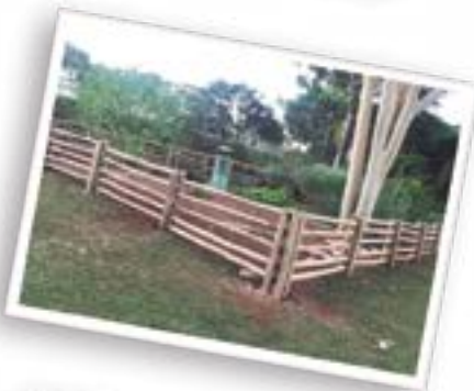
Recuperação da ponte da nascente do Córrego Botafogo