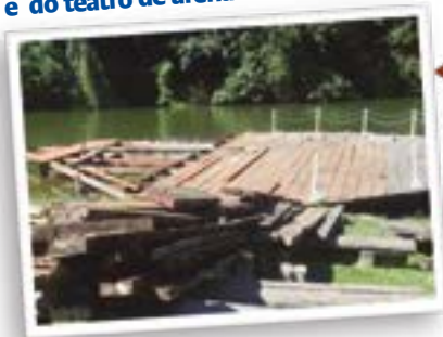
Reconstrução do deck e do teatro de arena

Veja quais foram os itens revitalizados, nas obras de recuperação do Jardim Botânico de Goiânia, financiadas pelas cooperativas goianas, o Sistema OCB/SESCOOP-GO e o governo municipal.