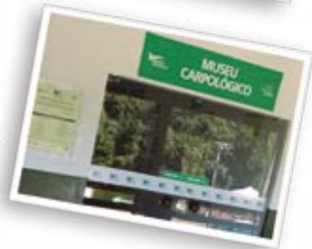
Substituição e ampliação do sistema de sinalização do Jardim Botânico