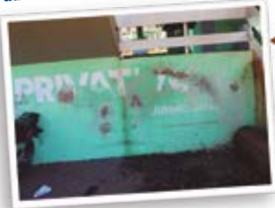
Pintura da sede administrativa do parque