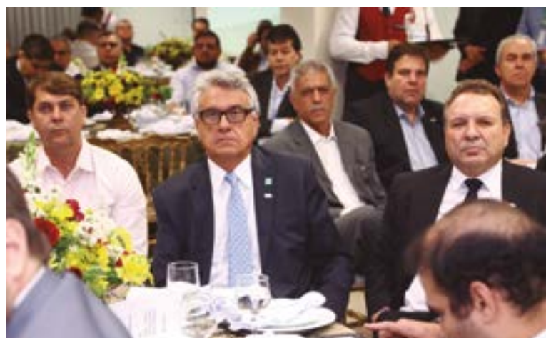
Lideranças cooperativas e autoridades políticas prestigiaram cerimônia de oficialização da OCB-GO na Juceg

ral e disse que, naquela época, já lutava pelo cooperativismo no Congresso Nacional. Disse, ainda, que se sentia em casa por, também, ser um cooperativista. Ele parabenizou as três entidades por se tornarem parte do plenário da Juceg. “O governo do Estado, ao ouvir a reivindicação de seus nomes como membro da Juceg, se curvou ao entendimento de que é primordial, para essas importantes entidades e para a nossa economia, que elas sejam membros da Juceg”, frisou.