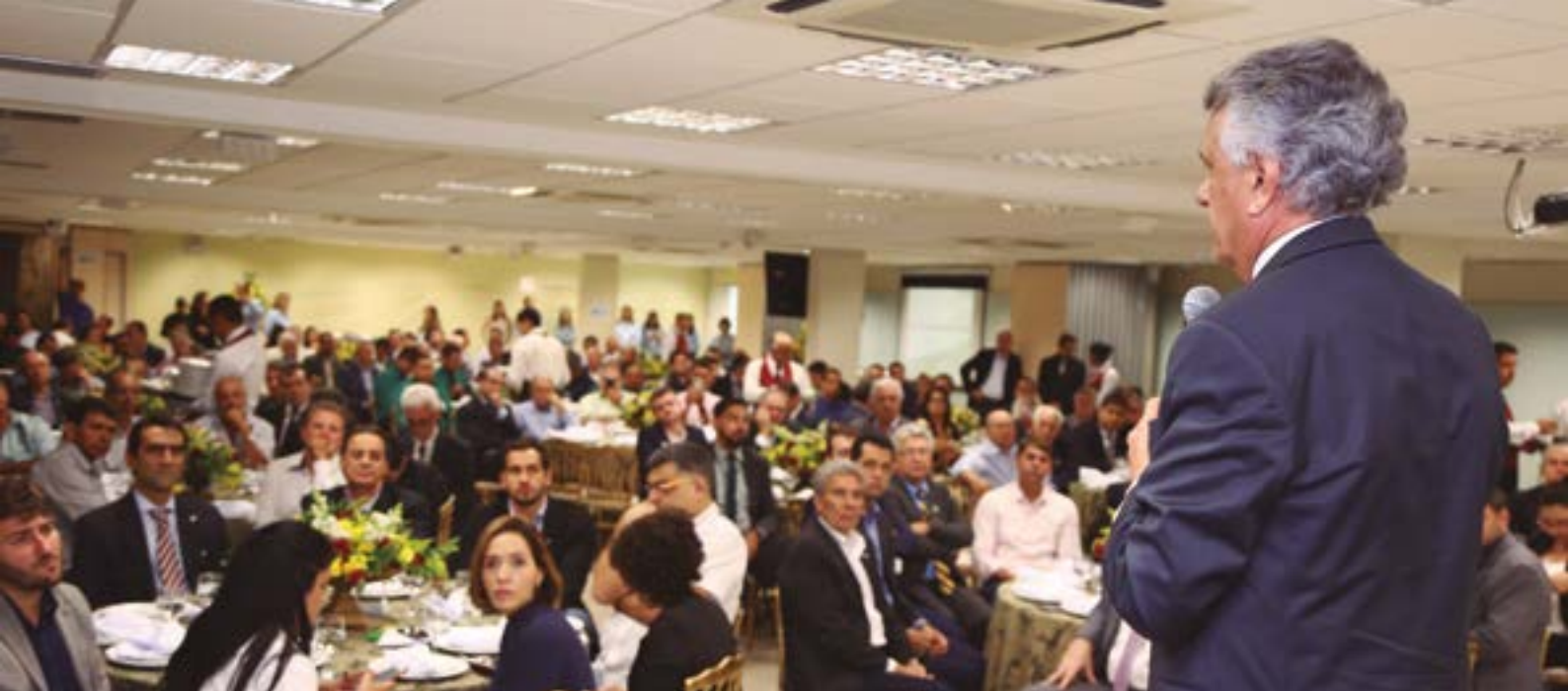
Em discurso na sede do SESCOOP/GO, Ronaldo Caiado destacou a importância da OCB-GO para a economia de Goiás