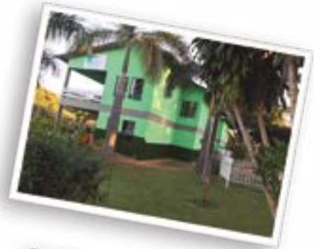
Museu Carpológico: pintura, porta de vidro e sinalização